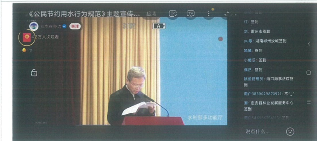
观看抖音短视频平台直播 3