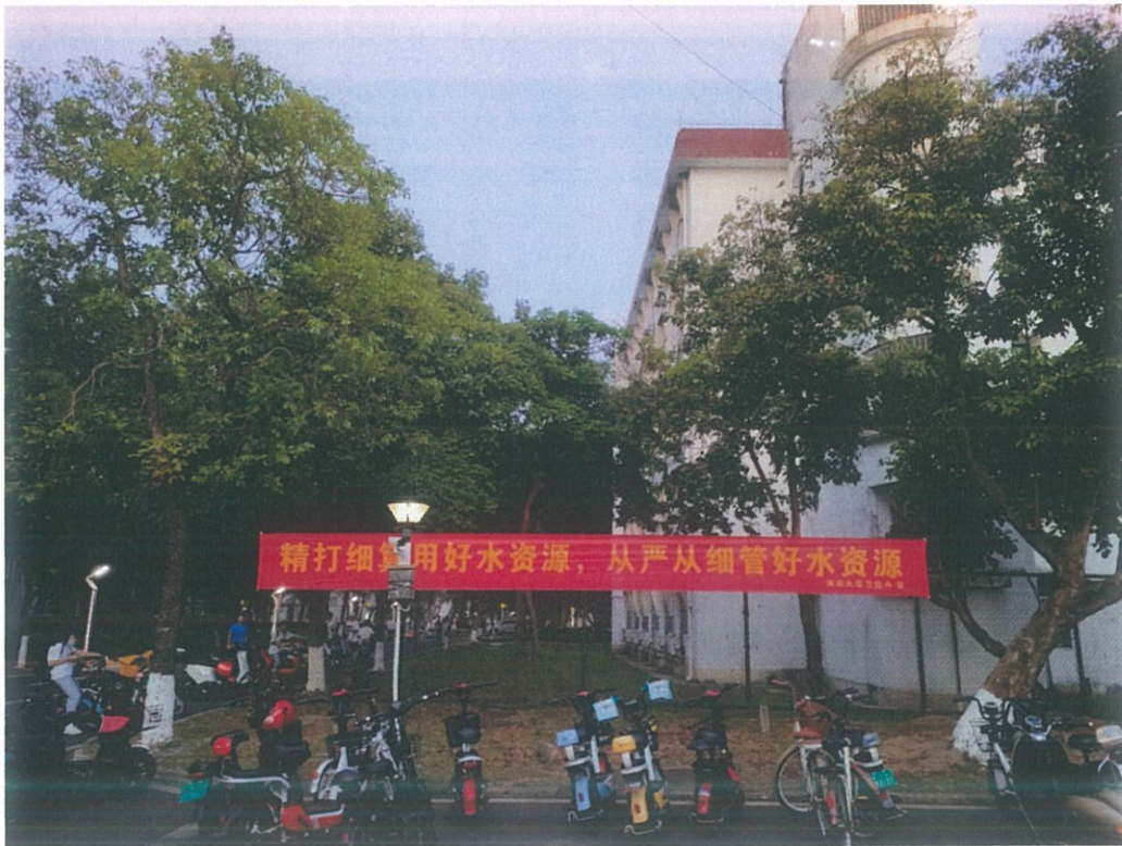
第五食堂门口悬挂宣传横幅