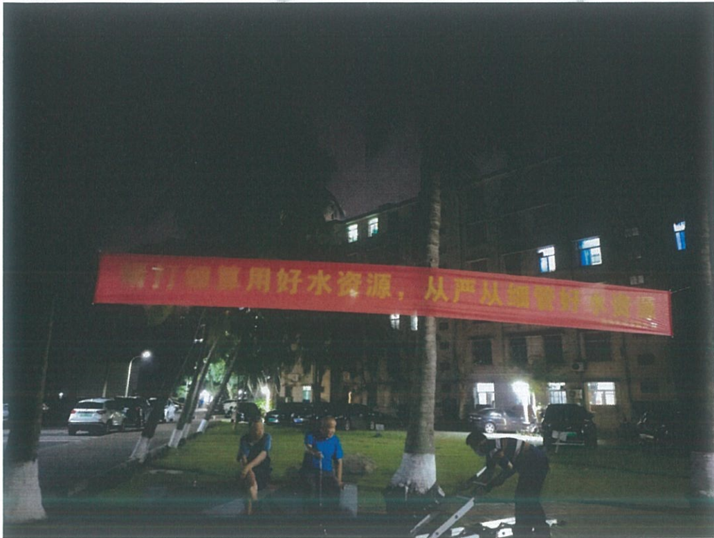
教工住宅区悬挂宣传横幅