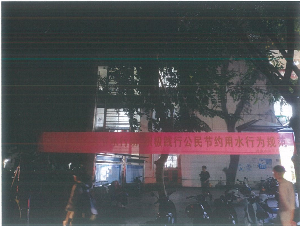
第六食堂门口悬挂宣传横幅