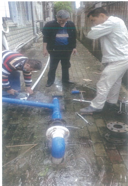
水资源设施设备检修 4