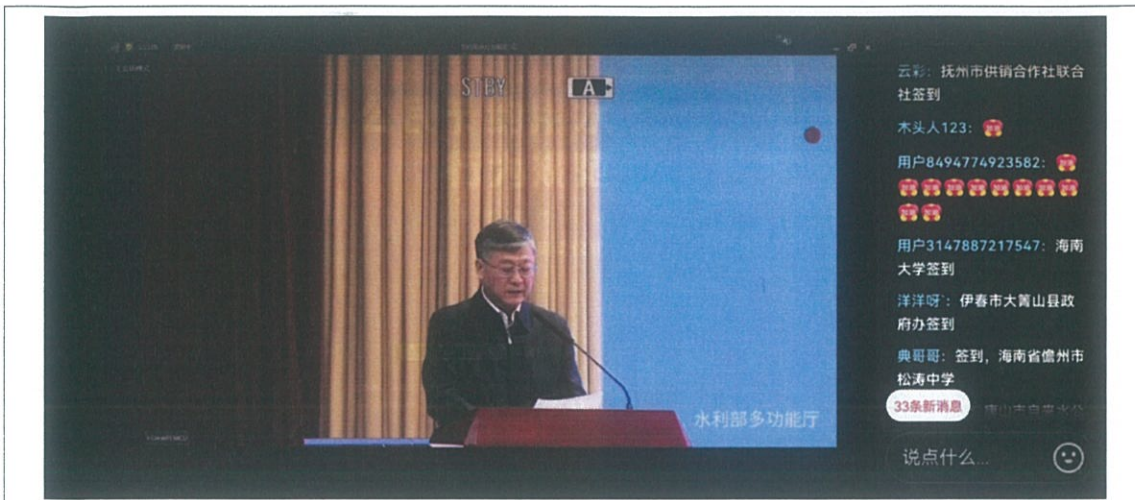
观看抖音短视频平台直播 1