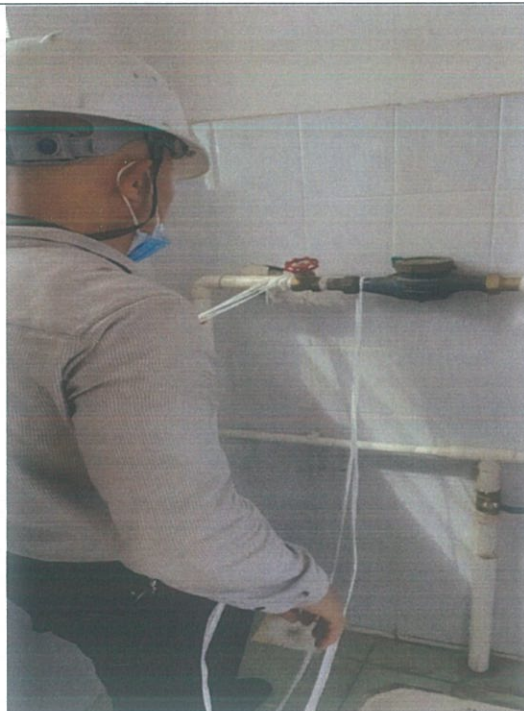
水资源设施设备检修 7