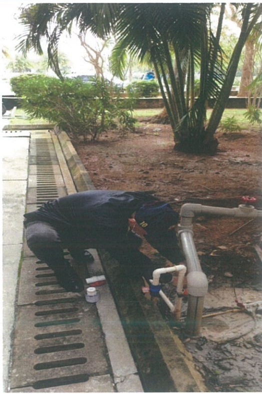
水资源设施设备检修 5