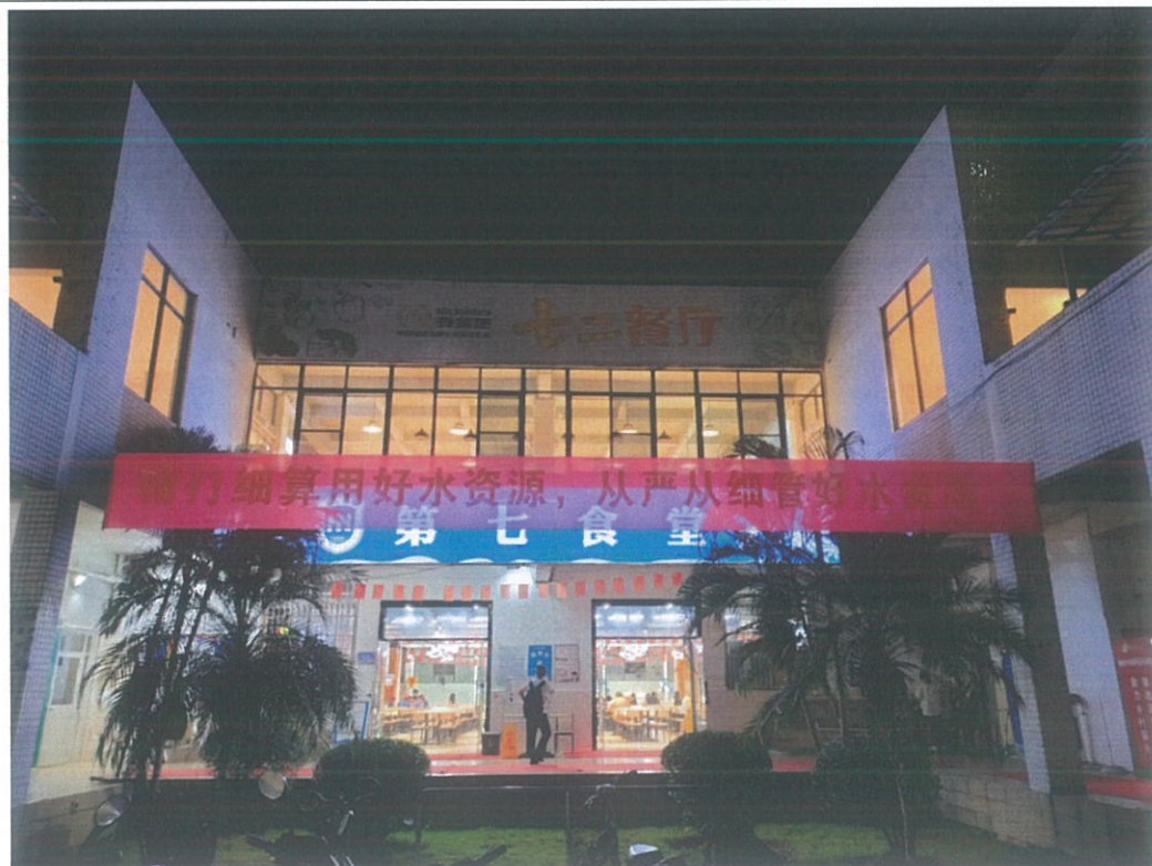
第七食堂门口悬挂宣传横幅