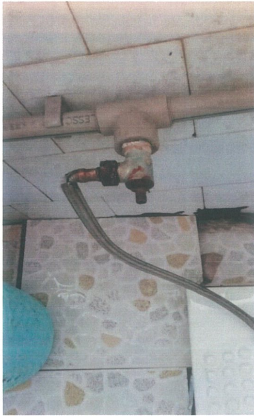
水资源设施设备检修 1