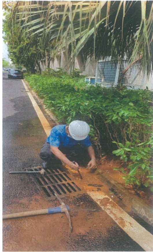
水资源设施设备检修 2