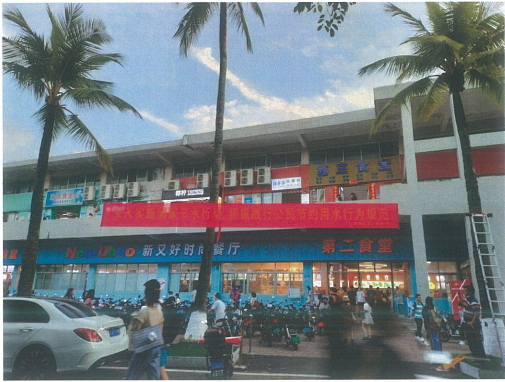
第二食堂门口悬挂宣传横幅