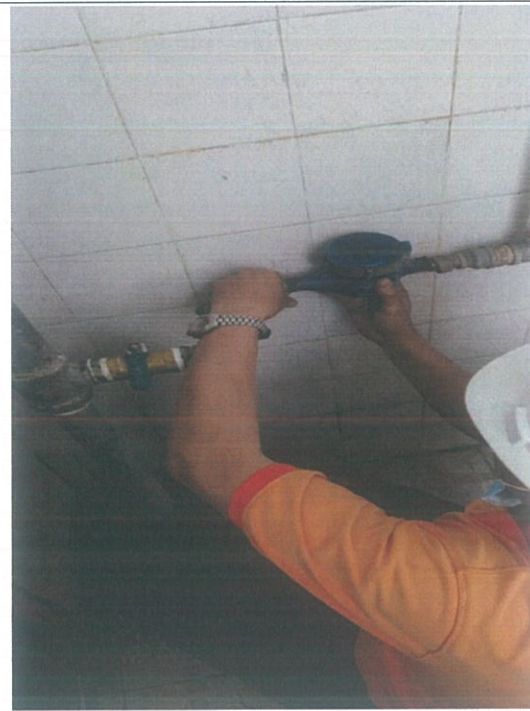
水资源设施设备检修 8