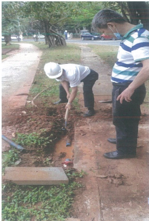
水资源设施设备检修 3