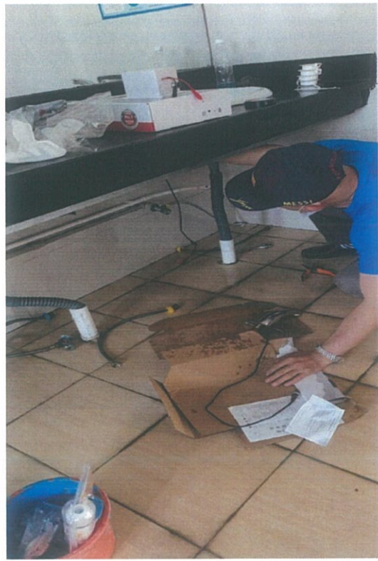
水资源设施设备检修 6